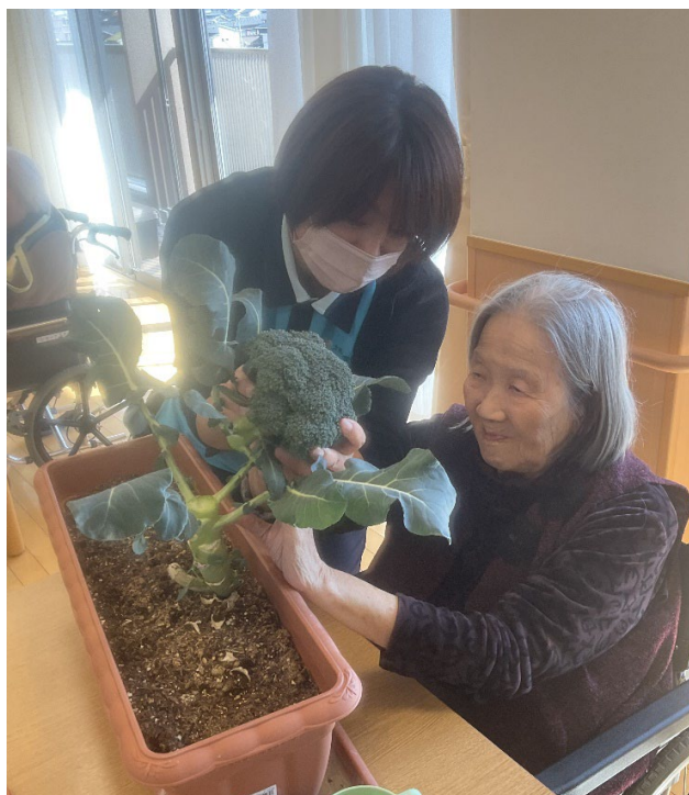
ブロッコリー収穫しました