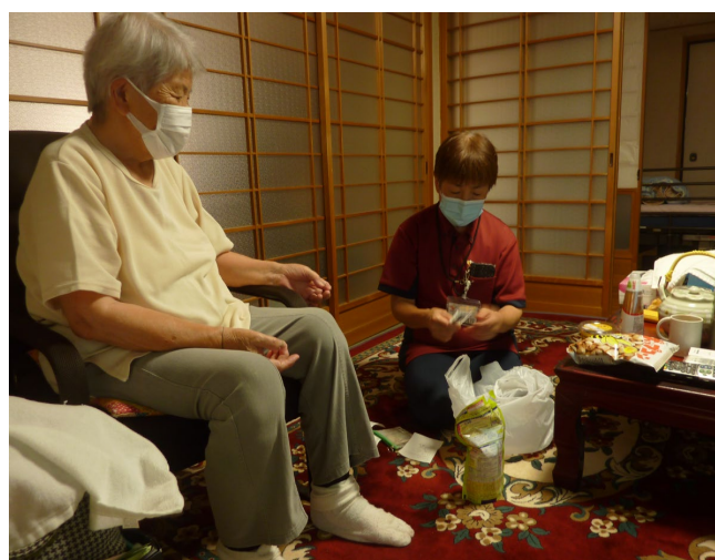
ヘルパーと買い物代金・品物確認