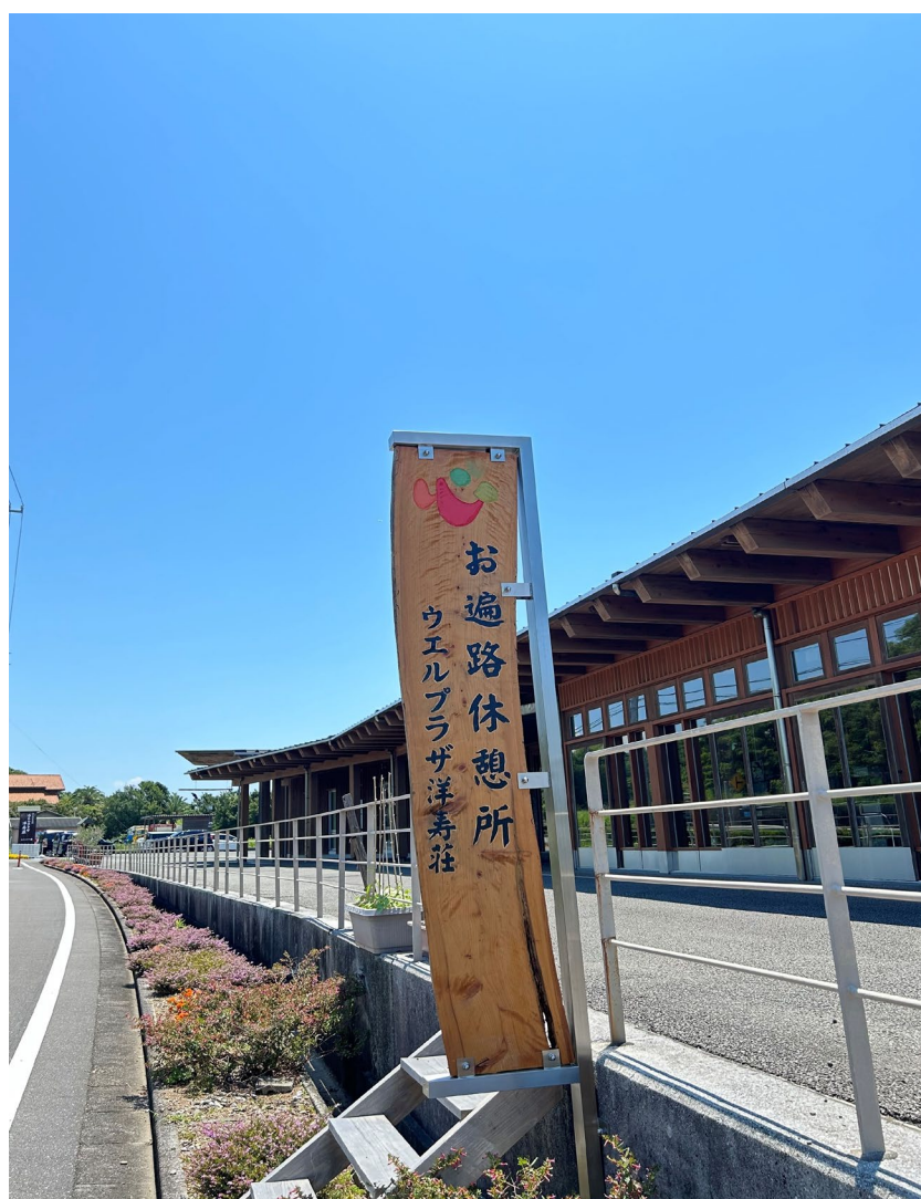
社会福祉法人の公益的事業として「お遍路休憩所」の運営