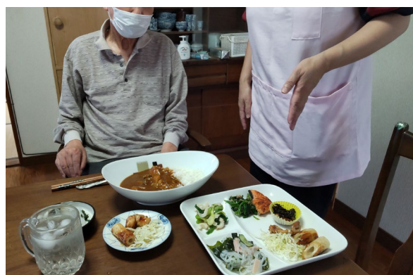
お昼ごはんを作りました