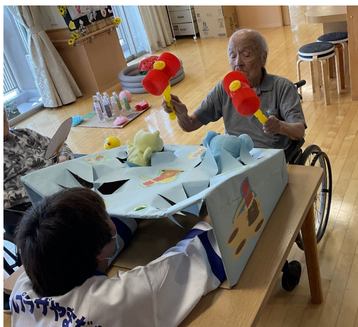
夏祭りでもぐらたたき