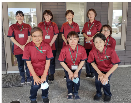
ヘルパースタッフ